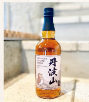
▲ ブレンドドウイスキー