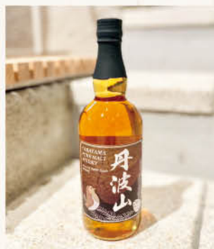
▲ ピュアモルトウイスキー

「モルトウイスキー」と「ブレンドドウイスキー」の2種類をつくり、「丹波山」の名前を冠した初めての酒類となります。ミズナラ樽の特徴である香木が感じられるウイスキーに仕上がりました。