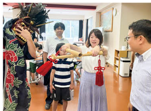
▲ ささら獅子舞の学習会にも参加