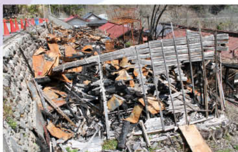
▲ 4月中旬の火災現場の様子