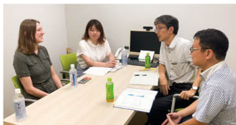
▲ ALT のラミー先生との意見交換

今年度から始まった「地方創生伴走支援制度」を通じ、文部科学省、農林水産省、経済産業省に所属する丹波山村の支援官が7月3日から4日にかけて村を訪れました。二度目の現地訪問となる今回は、移住定住や空き家対策、子ども支援等に関する取り組みについて意見交換を行いました。また、4日に小学校で開かれた、丹波山村文化財保存会による小中学校合同のささら獅子舞の学習会にも参加