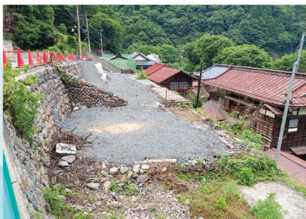
▲ 解体・撤去作業が完了した現場の様子 (6月中旬撮影)

令和6年10月に鴨沢地区で住宅8棟を焼く火災が発生したことについて、ふるさと納税型のクラウドファンディングをはじめ、村内外の多くの方からご厚意をお寄せいただき、合わせて1,000万円の寄附金が集まりました。